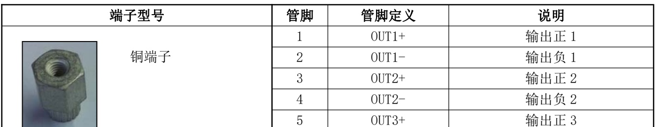
表 12 输出管脚定义表