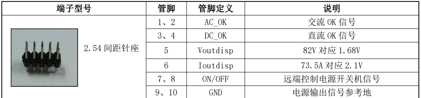
表 13 输出管脚定义表