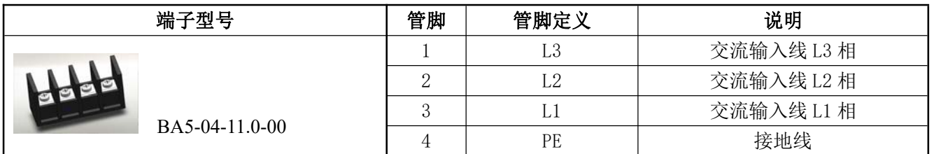
表 11 输入管脚定义表