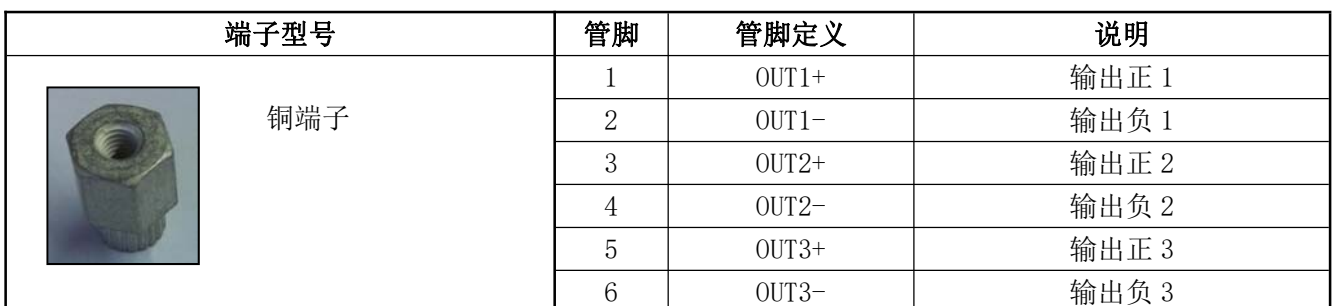
表 12 输出管脚定义表